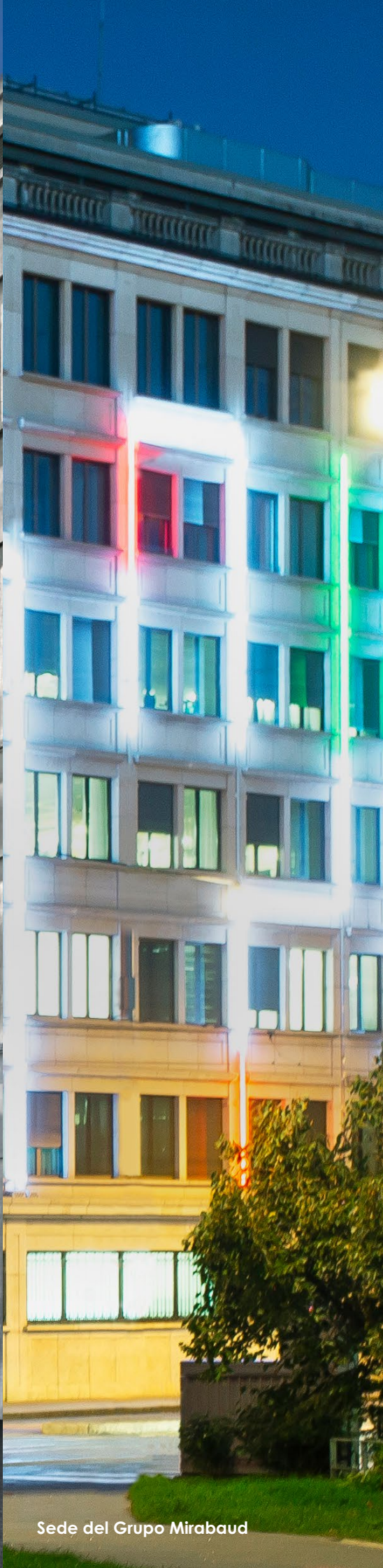
Sede del Grupo Mirabaud