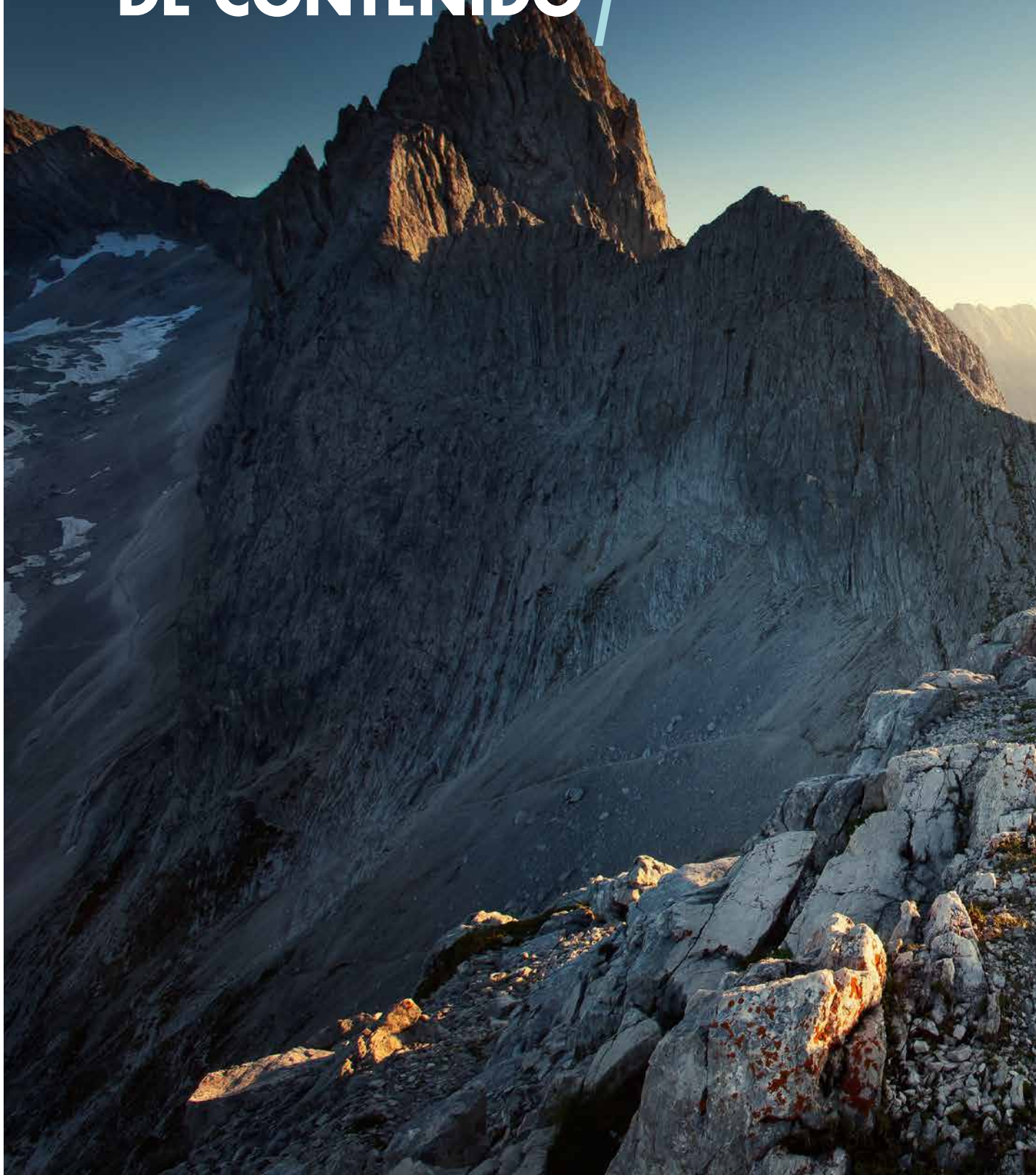
TABLA DE CONTENIDO /